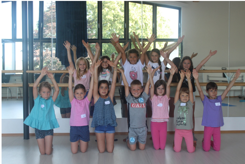
Das Musical-Team vom 9.8.2018 der Kinderspielstadt

Das Musicalteam in der Kinderspielstadt (die Treppe hoch neben dem Café) arbeitet sogar mit Freude bei der anstrengenden Aufwärmung und jeder macht mit so wie er kann.